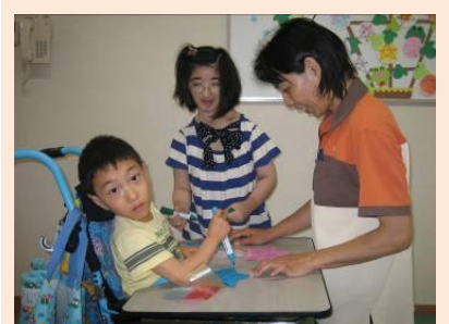
(写真上：ご家族の皆様と、下：作業の様子)