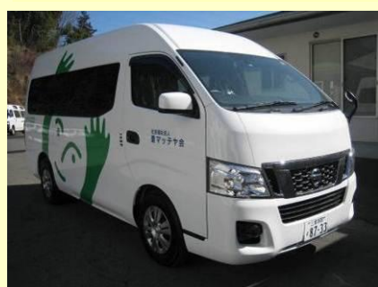
日産キャラバン(ワイドタイプ) 日本財団様助成事業

平成24年度の日本財団様の助成事業により日産キャラバン（ワイド幅）・スズキ エブリーワゴンの2台が加わりました。ありがとうございます。