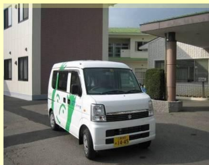
スズキ エブリーワゴン 日本財団様助成事業