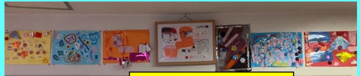
南勢就労支援センター