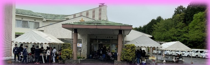
ミニマルシェの様子