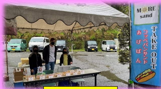
MORE SAND さん