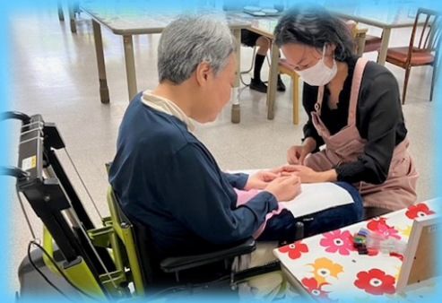
ネイル & ハンドマッサージ