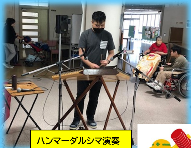
ハンマーダルシマ演奏