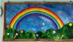
聖マッテヤ心豊苑

4月15日から4月30日までの期間で第8回マッテヤ展覧会を開催しました。初日の4月15日は春祭りも開催をしていたので、春祭りに来て頂いた方々にも作品を見て頂くことができました。聖マッテヤ心豊苑は、4月で30周年を迎え、30周年を記念に作成をした作品を展示しました。