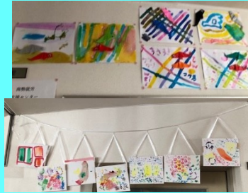
南勢就労支援センター