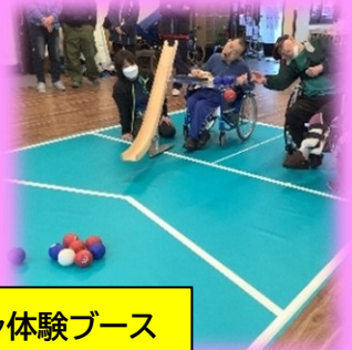
ポッチャ体験ブース