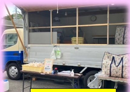
パッカン実演販売

3月9日に聖マッテヤ会チャリティーバザーを開催致しました。品物の寄付、寄付金、買い物をしてくださった皆様、ありがとうございました。売り上げは、日本赤十字社さんを通じて、今年1月に被災をされた石川県の被災地に寄付をさせて頂きました。