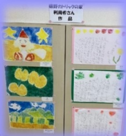
嬉野カトリックの家