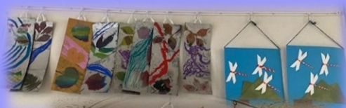
八野生活介護センター