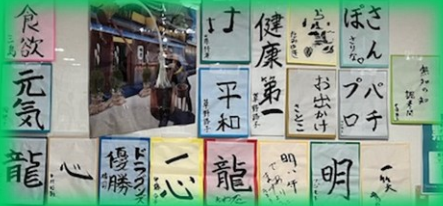
聖マッテヤ心豊苑

【参加利用施設】 聖マッテヤ心豊苑、南勢就労支援センターさん、あゆかさん、宮の里さん、向野園さん、ここふるさん、りんてらすさん、菰野聖十字の家さん、嬉野カトリックの家さん、梨丘園さん、ほっとランドさん、凜生園さん、飯高じゃんぷさん、いそっぷさん、和順学園さん、小山田苑さん、ベルフレンドさん、菰野陽気園さん、八野生活介護センターさん、風早の郷さん、湖畔の郷さん (順不同)