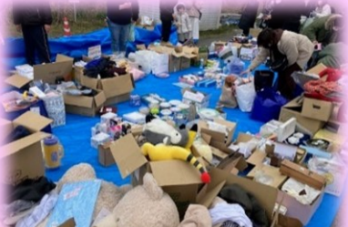
たくさんの品物の寄付を頂きました。